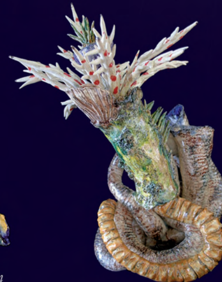
Hydroïdes Norvégica H: 35 cm