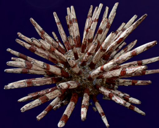
Strongylocentrotus Diam : 49 cm