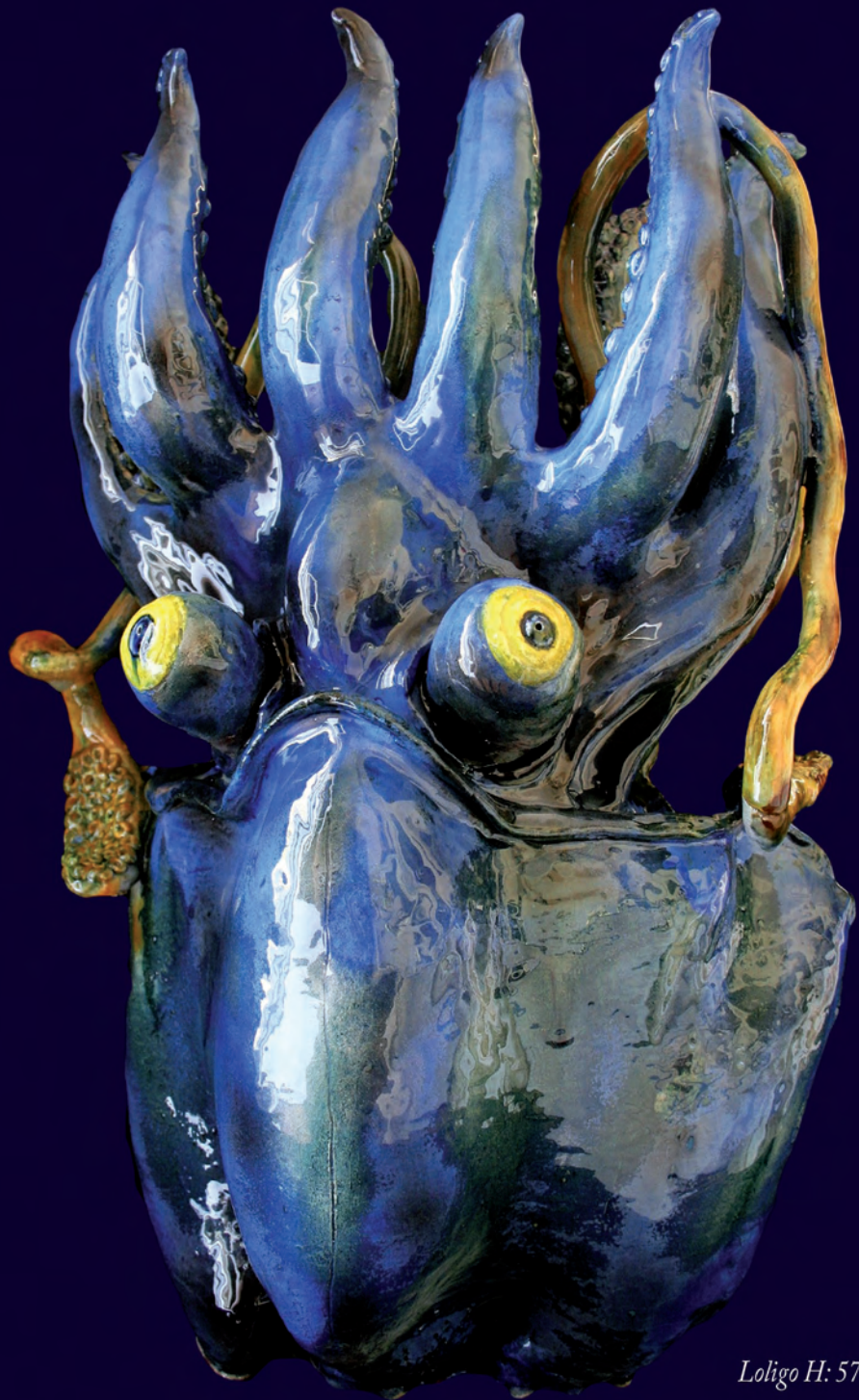
Loligo H: 57 cm l: 39 cm