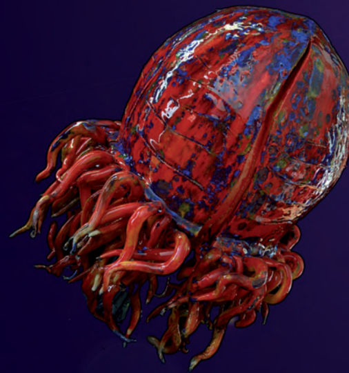
Méduse arctique H: 41 cm l: 29 cm