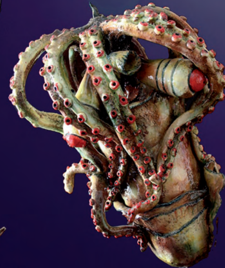
Octopode scruteur H: 44 cm l: 31 cm